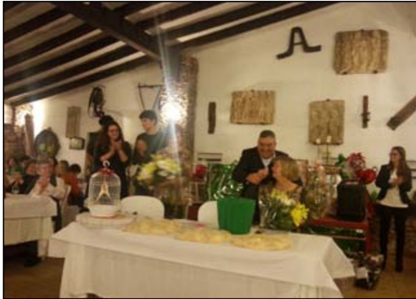
Despedida de la família Colom com a voluntaris al sopar anual.