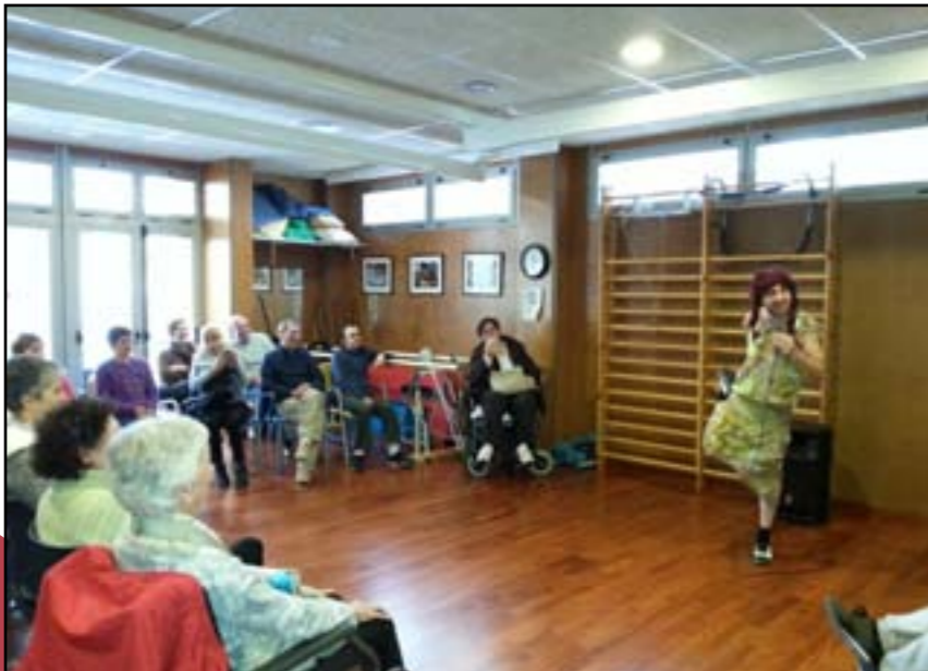
Festa de Nadal al centre