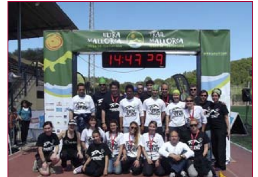
Voluntaris Ultra Mallorca Serra de Tramuntana