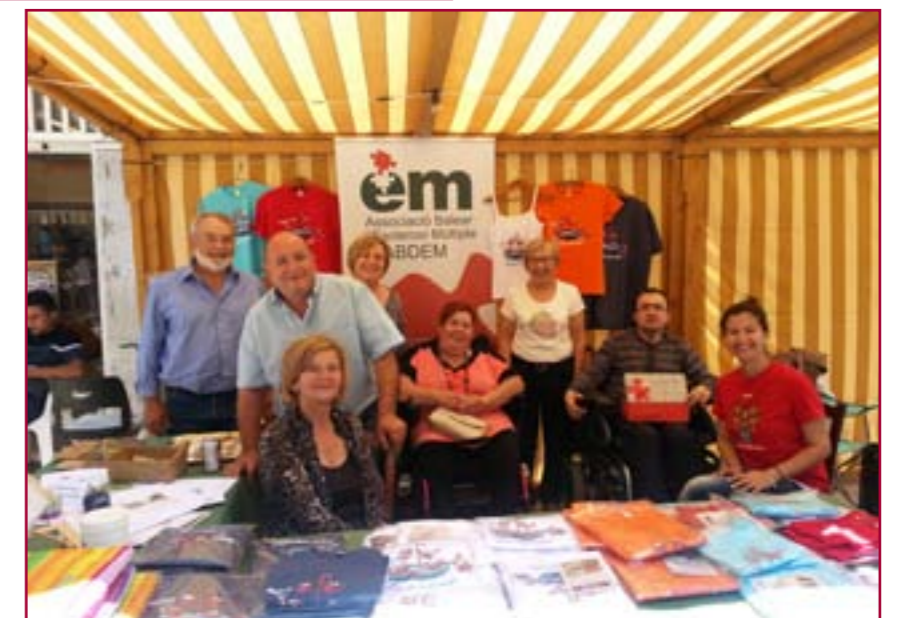
Taula informativa a Son Servera