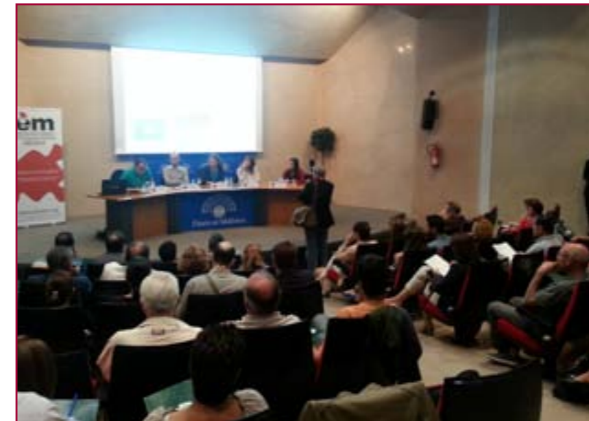
Dia mundial de l'EM