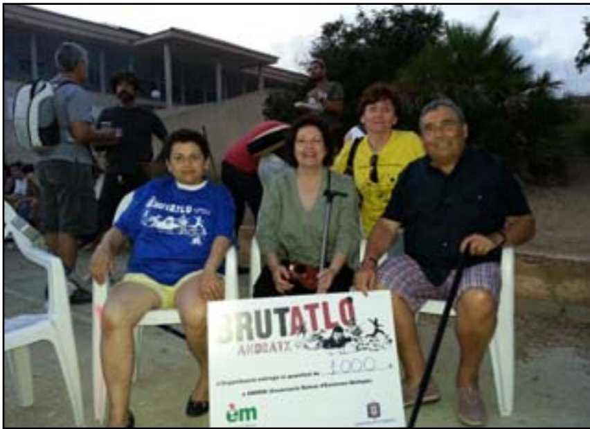
Brutatlló a Andratx